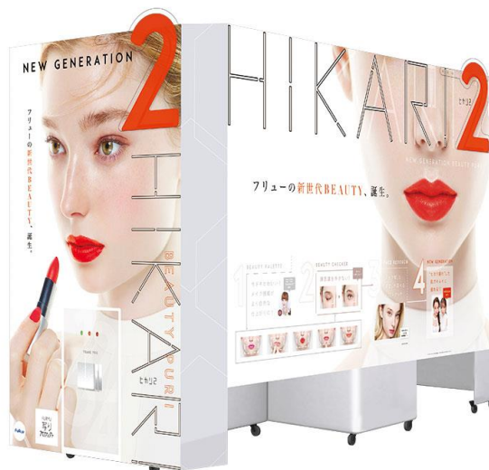
プリ機『HIKARI2』外観イメージ