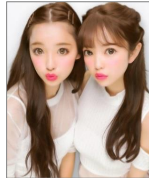
プリ機『HIKARI2』写り仕上がりにイメージ